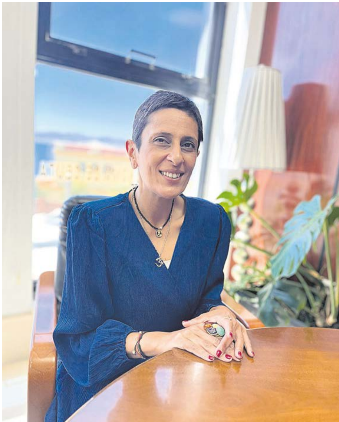
La consejera destaca la unidad de acción como una de las claves para la transformación económica de Ceuta.

sistema también es bueno para nuestros jóvenes.