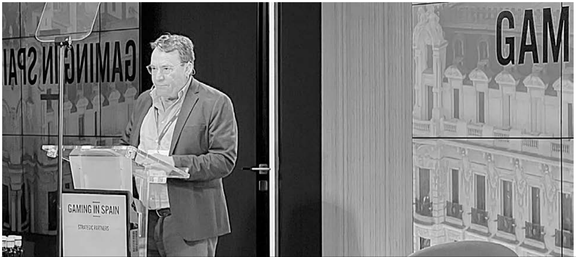
El director general de la compañía JDigital vendrá desde Madrid para participar como moderador durante las jornadas.