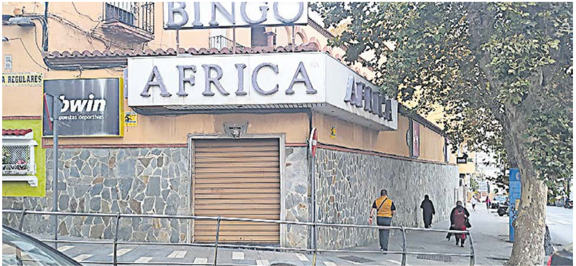
En los últimos años han sido decenas las empresas relacionadas con el juego online las que se han instalado en la Ciudad Autónoma.