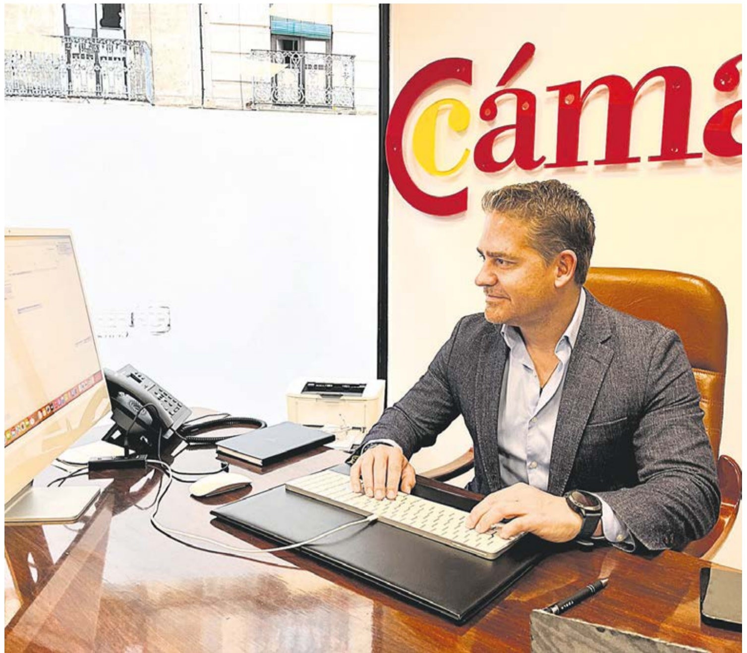
Recientemente, la Cámara de Comercio organizó en Ceuta un gran evento para atraer inversores y startups a la ciudad.

Vamos a tener en breve, además, una incubadora de inteligencia artificial que estará operativa en 15 meses y estamos trabajando con la Universidad de Granada para, efectivamente,