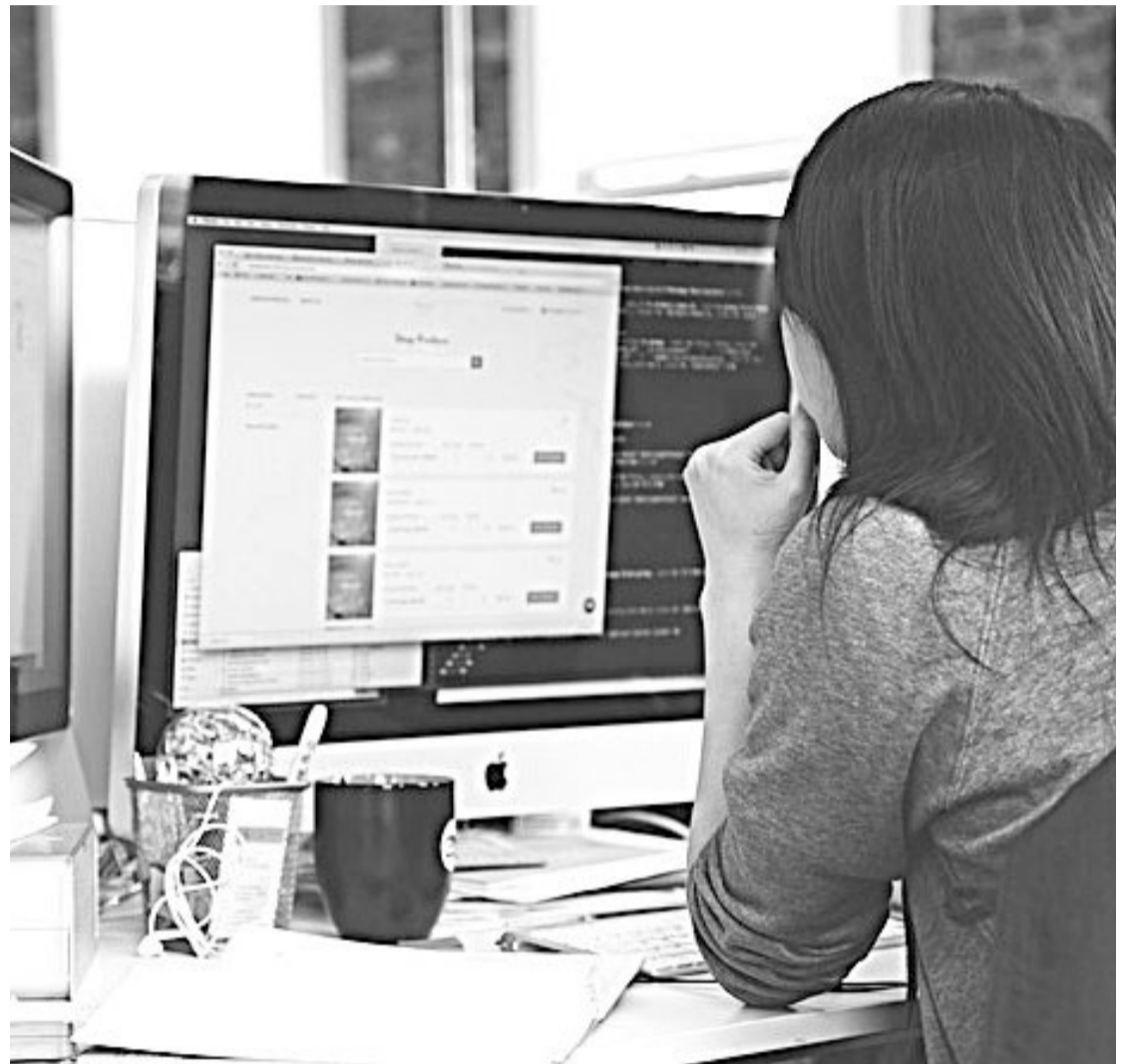
Betmedia es una empresa de base tecnológica y marketing digital.

Asenjo mira al futuro y afirma que Ceuta es un buen lugar no solo