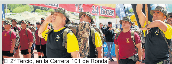
El 2º Tercio, en la Carrera 101 de Ronda

La 2ª prueba: "el dolor de garganta" Esta prueba consistía, una vez en el Cuartel del Rey pasar los aspirantes a legionarios al despacho del Teniente Coronel Millán Astray; Bienvenidos a la Legión. Aquí