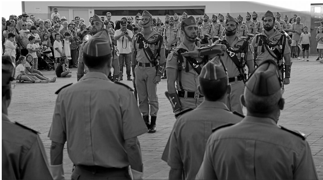
Actos llevados a cabo por la Legión el pasado jueves con motivo del 96 aniversario de su fundación.

La cita es hoy a las 20:00 horas. Los miembros de ambas agrupaciones musicales ofrecerán un concierto legionario en el Auditorio del Revellín para conmemorar esa fecha. Además, su actuación estará dedicada 'in memoriam' al